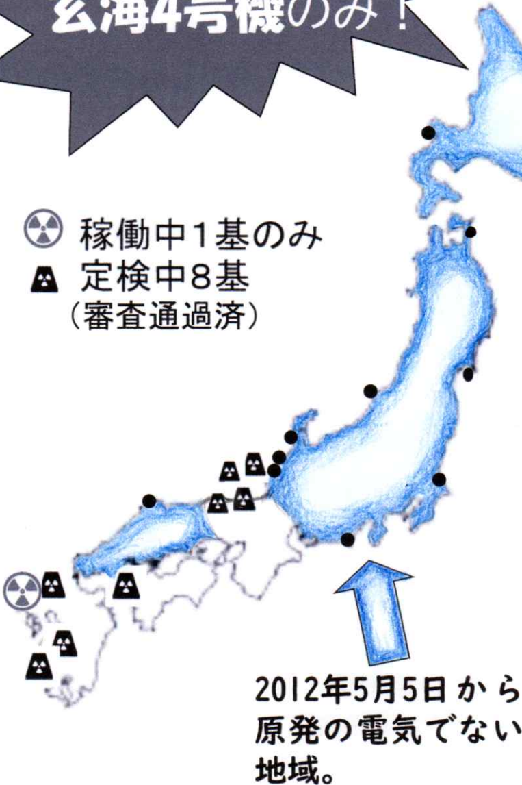
原子力発電所運転実績